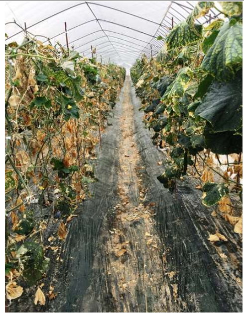
始良市蒲生町キュウリ栽培 (:H30,3月29日撮影)

薬剤散布をしているにもかかわらず、出てくる新芽がすべてスリップスに食害されて栽培終了間近に思えた。