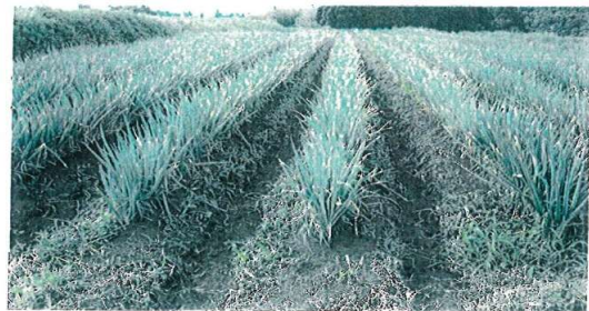
従来肥料施用の畑